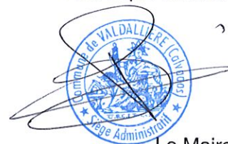
Le Maire, Frédéric BROGNIART

Accusé de réception - Ministère de l'Intérieur